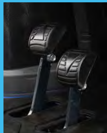
A hidrosztatikus hajtást vezérlő pedálok