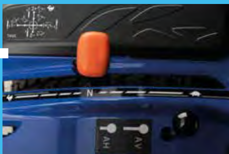
Mechanikus átváltó az első/hátsó hidraulikára